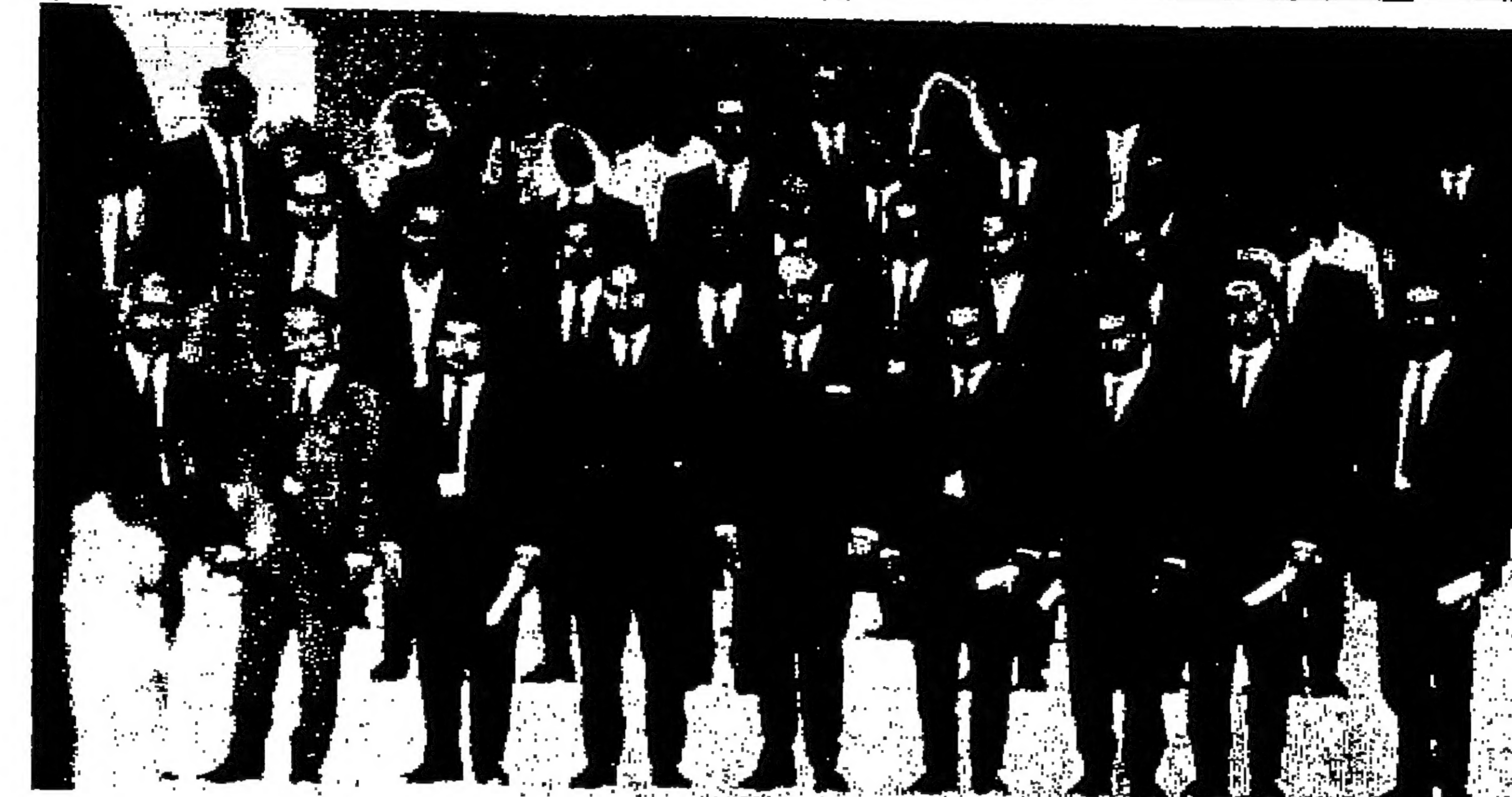
السيد حاتم الزعبي وزير الاقتصاد الوطني يتوسط طلبة مركز القديس الاجمالي الاردني بعد ان وزع عليهم شهادات التخرج يوم امس الاول

توزيع للتازحين عمان - تيرع الطلبة العرب في ألمانيا بكية من الادوية للتازحين في الاردن .